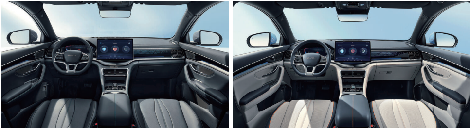
Siyah (Vegan deri)