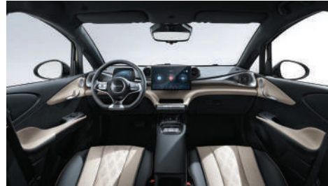
Siyah & Krem (Vegan deri)