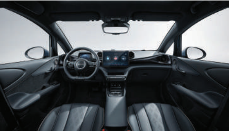
Siyah (Vegan deri)