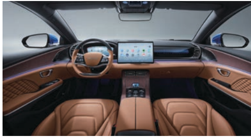
Taba (Nappa deri)