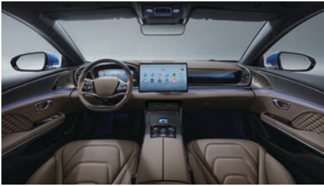
Kahverengi (Nappa deri)