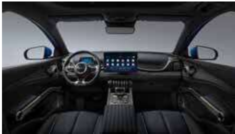
Siyah (Vegan deri)