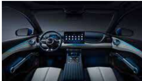
Lacivert & Beyaz (Vegan deri)